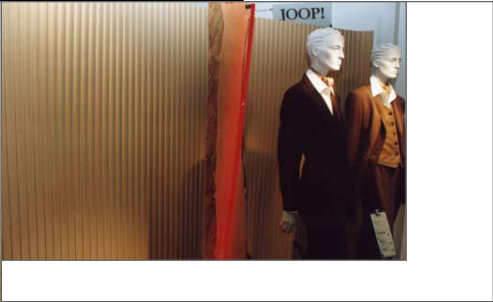
window display joop