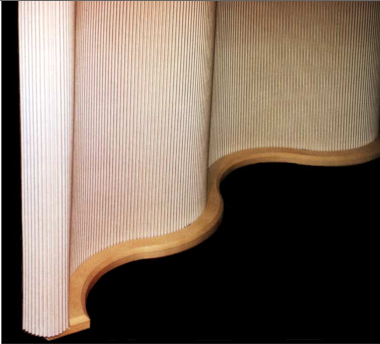
screen möbel pfister