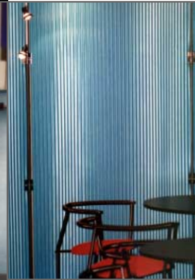
messestand nati gmbh