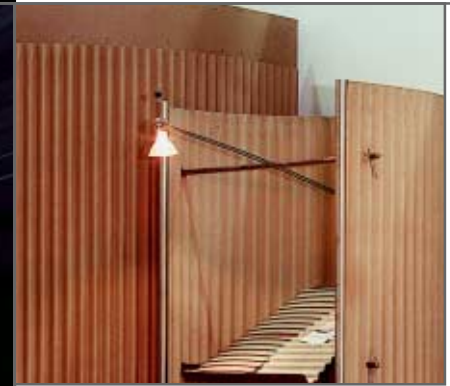
messestand weidmann ag & well gmbh