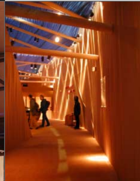
dünenlandschaft expo 2000