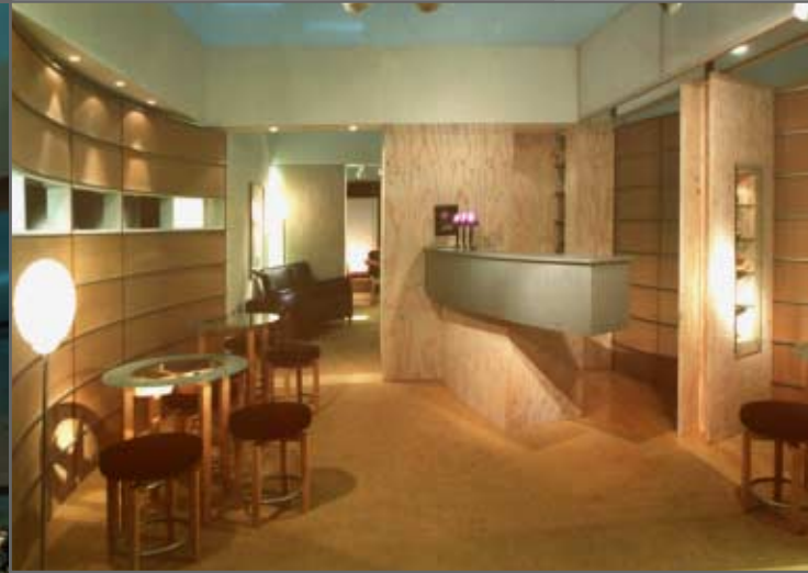
trennwand viva gmbh