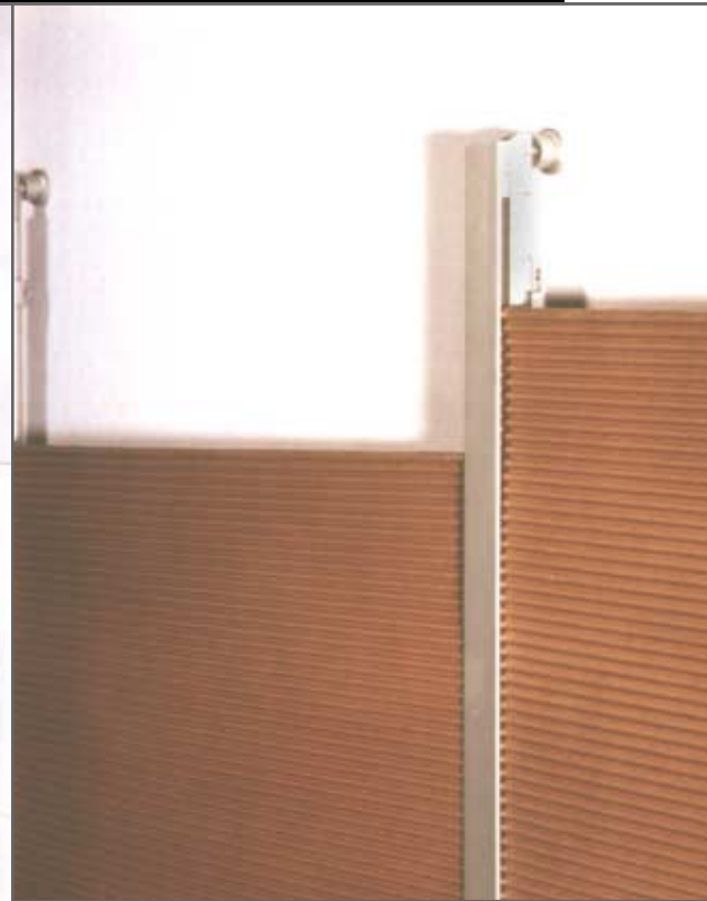
wand- und schrankverkleidung beate haehnel